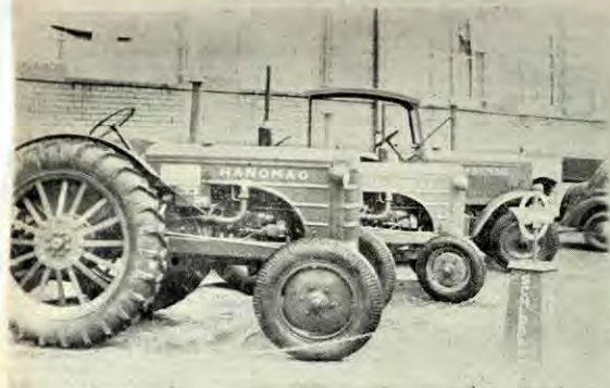
Eine „Batterie“ moderner Trecker

Zwei Tage Gewerbeausstellung der Stadt Borgholzhausen — Bis Mittwoch verlängert