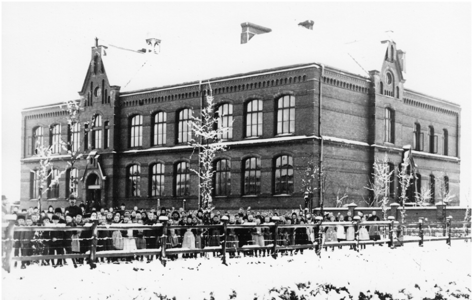
Die Volksschule am Kampgarten wurde für die Ausstellungen genutzt.

Über achtzehn Jahre später, die entbehrungsreichen Kriegs- und Nachkriegsjahre waren halbwegs überwunden, mochte man wieder nicht nur