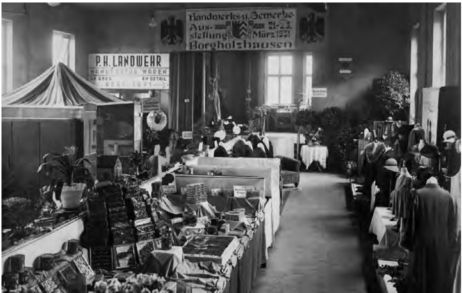
Blick in die Handwerks- und Gewerbeausstellung 1931

Vor diesem Hintergrund fand in Borgholzhausen vom 21. bis 23. März 1931 eine Handwerks- und Gewerbeausstellung statt. „Auch das Land hat einiges